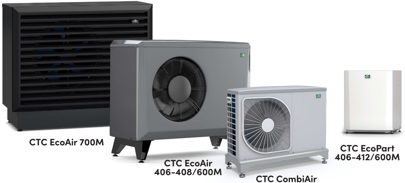
CTC EcoAir 700M

– ausführliche Informationen im entsprechenden Produktdatenblatt.