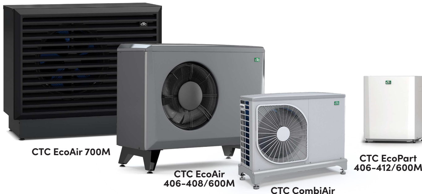
CTC EcoAir 700M

– for mere udførlige oplysninger henvises til de pågældende produktblade.